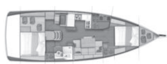
Version D Cabina armatore a prua + guardaroba, 1 cabina poppa / 1 bagno