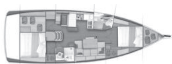
Versione A Cabina armatore a prua 1 cabina poppa / due bagni